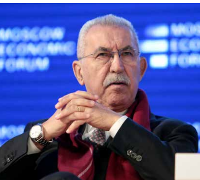
Джульетто Кьеца, итальянский журналист, писатель и общественный деятель

У России есть фундаментальный враг — это система СМИ. Потому что всё, что вы думаете здесь, всё, что думают за рубежом в основном определено системой СМИ, которая создавалась в течение 30 последних лет.