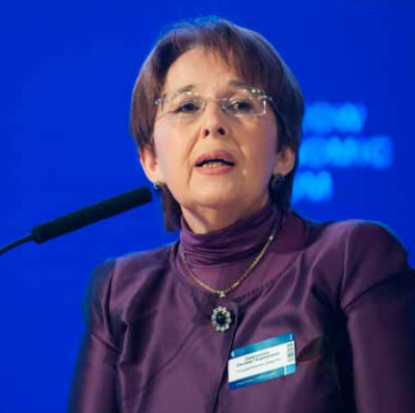
Оксана Дмитриева, член комитета Государственной Думы РФ по бюджету и налогам

Мы видим снижение доходов населения. Это важнейший тормоз экономического роста, поскольку нет платежеспособного спроса. Здесь нужно переходить к индексации. Пенсии и зарплаты должны быть повышены, как минимум, на 15%. Государственный заказ сегодня тоже выступает не как стимул, а как тормоз. Нужно отказаться от тендеров по многим направлениям и перейти к государственному контракту.