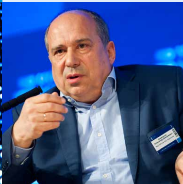
Александр Некипелов, академик РАН, директор Московской школы экономики МГУ

Мы потеряли основную часть высокотехнологических производств, решив осуществить трансформацию в шоковом режиме любой ценой. Она сопровождалась массой конфликтов, обнищанием населения, многочисленными противоречиями. И сам по себе этот факт сказался на состоянии нашей политической системы.