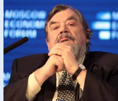
Эрик Райнерт, норвежский экономист

Мы видим снижение доходов населения. Это важнейший тормоз экономического роста, поскольку нет платежеспособного спроса. Здесь нужно переходить к индексации. Пенсии и зарплаты должны быть повышены, как минимум, на 15%. Государственный заказ сегодня тоже выступает не как стимул, а как тормоз. Нужно отказаться от тендеров по многим направлениям и перейти к государственному контракту.