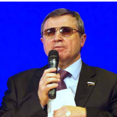
Олег Смолин, первый заместитель председателя комитета ГД РФ по образованию

Сегодня образование в России, как и экономика, пребывает в кризисном состоянии. Предпринимаемые Правительством меры ведут не к оздоровлению ситуации, а напротив, имеют разрушительный эффект. Более того, они угрожают потерей значительной части интеллектуального и человеческого потенциала страны. Главной проблемой по-прежнему остаётся экономия бюджетных средств на отрасли — уровень финансирования образования в России предпоследний из развитых стран.